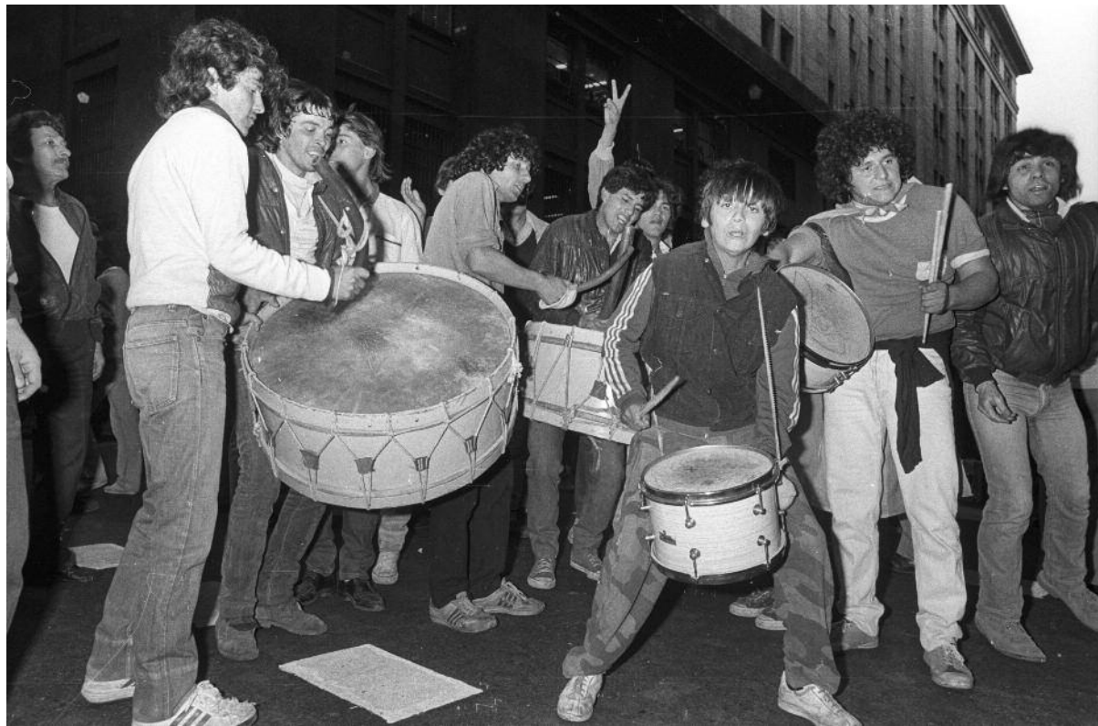
LUCIO SOLARI / ARCHIVO NACIONAL DE LA MEMORIA